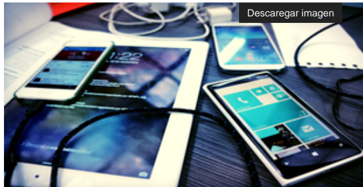
Medios de comunicación adoptan el periodismo móvil

auge de las redes sociales y al mismo tiempo la comercialización de los teléfonos móviles, que poco a poco fueron incluyendo la cámara fotográfica en los dispositivos. En este caso, el contexto que rodea al periodista actual se caracteriza por la prontitud, la flexibilidad y la proximidad para adaptarse a los cambios que suceden constantemente en la actualidad. Por lo tanto, esta técnica requiere periodistas polivalentes, capaces de dirigir, producir y distribuir las noticias.